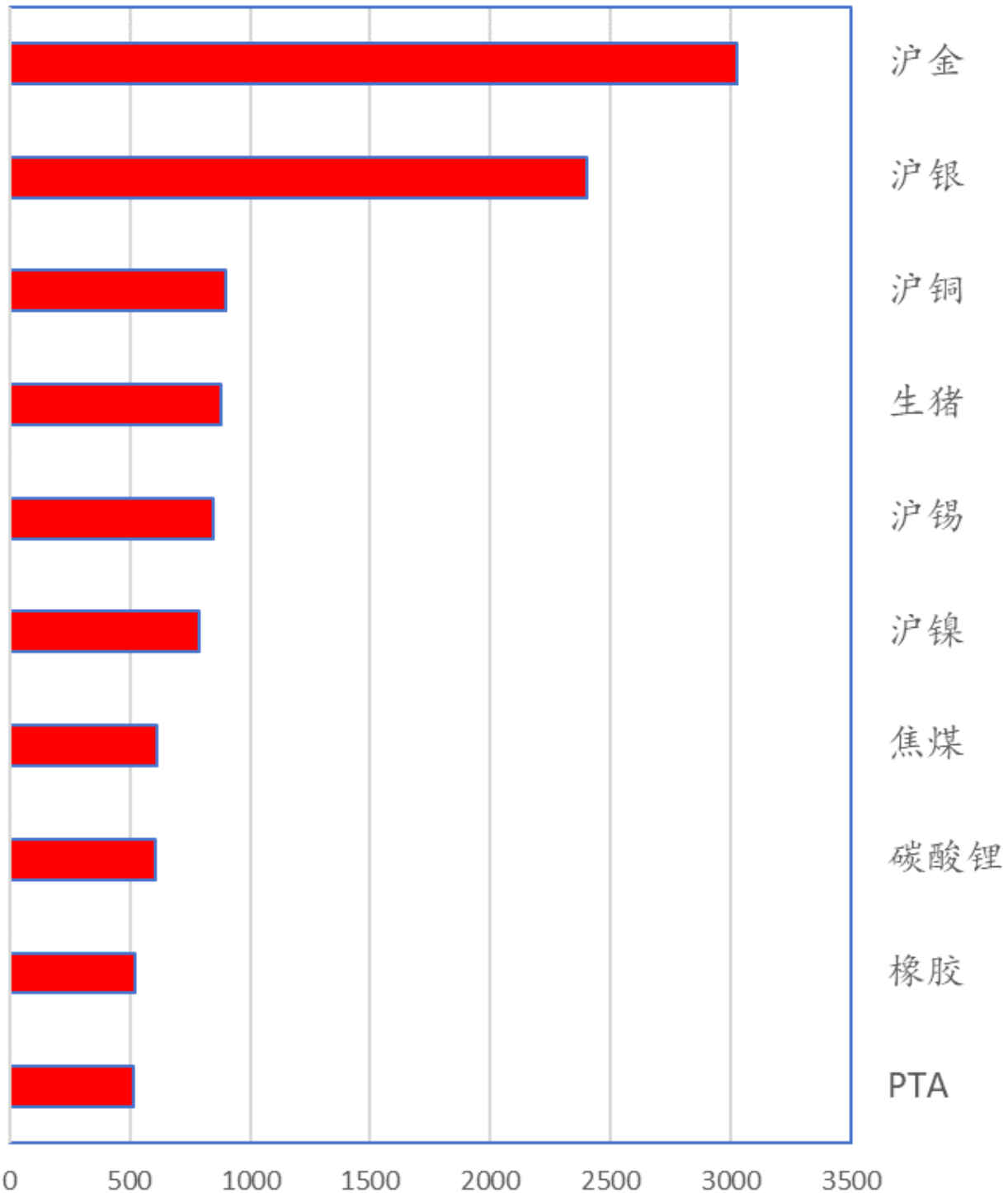
商品期货成交金额（亿元）