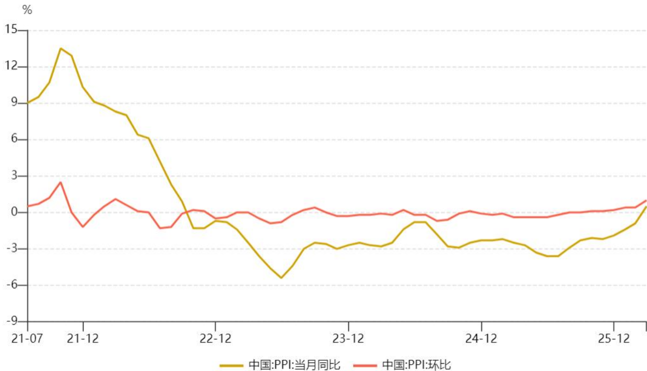
图1：国内 PPI 同比和环比。